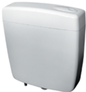
Бачок пластиковый для унитаза ID A 102